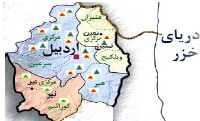
شکل ۲. پراکنش نماتد سیستی غلات در استان اردبیل طی دو سال پژوهش (▲: مشاهده شده در سال اول، ▲: مشاهده شده در سال دوم، ▲: عدم مشاهده).

Figure 2. Distribution of Cereal Cyst Nematode in Ardabil province during two years survey (▲: observed in the first year, ▲: observed in the second year, ▲: not seen).