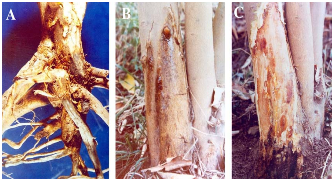
شکل ۱. A- ریشه و طوقه درخت لیمو شیرین آلوده به انگومک، B و C- طوقه درخت گریپ فروت آلوده به انگومک (اصلی).