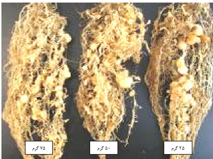
شکل ۶- بوته‌های خیار تیمار شده با غلظت‌های مختلف شکل تجاری گل جعفری

نتایج حاصل از بررسی اثر غلظت‌های مختلف گل جعفری گرانوله در مهار M. javanica روی خیار گلخانه‌ای، نشان داد که فرم تجاری این گیاه، با توجه به ترکیبات تشکیل‌دهنده آن، حتی در غلظت‌های بالا، قادر به کاهش تعداد غده روی ریشه و جمعیت نماتد روی میزبان خیار نیست (شکل ۶). گل جعفری گرانوله، به دلیل نداشتن خاصیت سمی، نتوانست همانند فرم طبیعی این گیاه که قادر به تولید و ترشح مواد سمی است، در مهار نماتد نقشی داشته باشد. این ترکیب تجاری، تنها به دلیل همراه داشتن مواد آلی و سایر مواد موردنیاز برای رشد گیاه در ترکیبات خود، قادر بود در رشد رویشی گیاه و شادابی آن نقش داشته باشد (ابوترابی ۱۳۹۳). برخی از گونه‌های گیاه گل جعفری از جمله گونه‌ی T. signata رقم Tangerine Gem باعث تکثیر و تولیدمثل نماتد می‌شوند و نقش مهارکنندگی روی نماتد ندارند (Ploeg & Maris 1999). لذا در فرم گرانوله‌ی مورد آزمایش، با توجه به ارزیابی جمعیت نهایی و عامل تولیدمثل نماتد که نشان داد، با افزایش غلظت فرم تجاری، بر میزان جمعیت نماتد افزوده می‌شود، لذا می‌توان گفت که فرم گرانوله، احتمالاً برگرفته از ارقام حساس گیاه گل جعفری باشد که در افزایش جمعیت نماتد نقش داشته است و به‌عنوان یک عامل جایگزین و مهارکننده‌ی نماتد قابل توصیه نمی‌باشد.