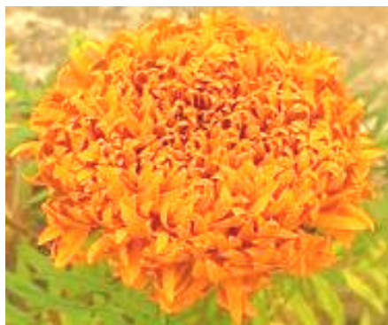
شکل ۲- گل جعفری آفریقایی Tagetes erecta

مختلف، نشان داد که همه ارقام، مهارکننده‌ی تفریح تخم و فعالیت لارو سن دوم M. incognita بودند. اکثر ارقام متعلق به گونه‌ی T. erecta از جمله رقم‌های Crackerjack و Flor de muerto و ارقام متعلق به گونه‌ی T. patula از جمله ارقام Bonita mixed، Gypsy sunshine، Scarlet Sophia، Tangerine و Single gold قادرند به خوبی نماتد مولد غده ریشه را مهار نمایند (Ploeg & Maris 1999) مضافاً اینکه ارقام گونه‌ی T. erecta به دلیل تولید ترشحات زیاد، توانایی بیشتری در مهار جمعیت نماتد در مقایسه با ارقام گونه‌ی T. patula دارند (Kalaiselvam & Devaraj 2011). تأثیر گونه T. erecta در کاهش جمعیت نماتد مولد غده ریشه روی لوبیا چشم‌بلبلی و همچنین افزایش رشد رویشی گیاه از جمله وزن ریشه، طول اندام هوایی، تعداد برگ و میزان محصول نیز گزارش شده است (Olabiya et al. 2007). کشت هم‌زمان این گونه به همراه گوجه‌فرنگی در مزرعه آلوده به M. incognita سبب کاهش تعداد غده روی ریشه و همچنین افزایش رشد رویشی گیاه و میزان محصول گردید (Natarajan et al. 2006). این گونه از گل جعفری مهارکننده‌ی Hoplolaimus و Helicotylenchus multinctus Cobb, 1893، Radopholus similis . Cobb, 1893 و indicus sher, 1963 در اراضی تحت کشت موز نیز می‌باشد (Wang et al. 2007).