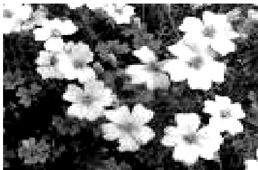
شکل ۵- گل جعفری سیگناتا Tagetes signata

روی مہار چہار گونہ M. javanica ، M. incognita ، M. arenaria و M. hapla مورد بررسی قرار گرفت. ہمہی گونہ‌های نماتد، روی ریشہی گونہ T. signata رقم Tangerine Gem تولیدمثل نموده و تکثیر یافتند (Ploeg & Maris 1999). در اکثر مواقع گونہ‌های مختلف Tagetes spp. قادرند ہر چہار گونہ نماتد مولد غدہ ریشہ را مہار نمایند (Suatmadji 1969).