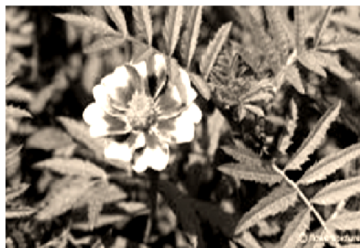
شکل ۱- گل جعفری فرانسوی Figure 1. Tagetes patula

محل اصلی رویش این گونه، کشور مکزیک و امریکای مرکزی است (شکل ۲). لوتئین استخراج‌شده از این گیاه، به‌عنوان آنتی‌اکسیدان در طب سنتی کاربرد دارد و از ترشحات ریشه آن برای مهار نماتد بخصوص گونه Pratylenchus penetrans استفاده می‌شود (Kimpinski et al. 2000). در بررسی‌های آزمایشگاهی به عمل آمده، ترشحات استخراج‌شده از ریشه ارقام T. erecta ، T. patula و T. minuta L. در غلظت‌های