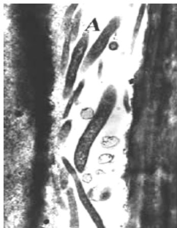
شکل ۱. تصویر میکروسکوپ الکترونی سلول‌های Liberibacter sp. در آوندهای گیاه (Jagoueix et al. 1994).

باکتری از جنس Liberibacter از خانواده Phyllobacteriaceae و از رده‌ی Proteobacteria است (شکل ۱). گونه‌های مختلف این جنس که بر اساس حساسیت به دما، خصوصیات سرولوژیکی، مولکولی، هیبریداسیون دی‌ان‌ای و آنالیز آران‌ای ریبوزومی (16SrRNA) معرفی شده‌اند عبارت‌اند از: Liberibacter africanus Jagoueix et al. ، Liberibacter asiaticus Jagoueix et al. 1994 (Las) و 1994 (Laf) و 2005 (Lam) Liberibacter americanus Teixeira et al. 2005 (Lam) (Chung & Brlansky 2005). هر کدام از آن‌ها در منطقه جغرافیایی خاصی انتشار دارند. این باکتری‌ها در محیط‌های کشت معمولی باکتریایی رشد نمی‌کنند. Las که در آسیا بیشتر شایع است، انتشار جهانی دارد و در دماهای نزدیک به ۳۵ درجه سانتی‌گراد نیز ایجاد بیماری می‌کند (Bové 2006). تا همین اواخر Lam تنها در برزیل گزارش شده بود اما اکنون از یونان و چین نیز