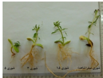
شکل ۱- نونهال‌های گونه ارژن (مبداء: کازرون)

نتایج آنالیز واریانس نشان داد اثر شوری بر روی تمامی صفات به غیر از وزن خشک ریشه‌چه معنی‌دار بود (جدول ۲). اثر مبداء بذر نیز بر روی صفات طول ساقه‌چه و ریشه‌چه، وزن‌تر ساقه‌چه و ریشه‌چه، وزن خشک ریشه‌چه و ضریب آلومتری معنی‌دار بود اما اثر متقابل این دو فقط بر روی وزن‌تر ریشه‌چه و ساقه‌چه معنی‌دار بود (جدول ۲).