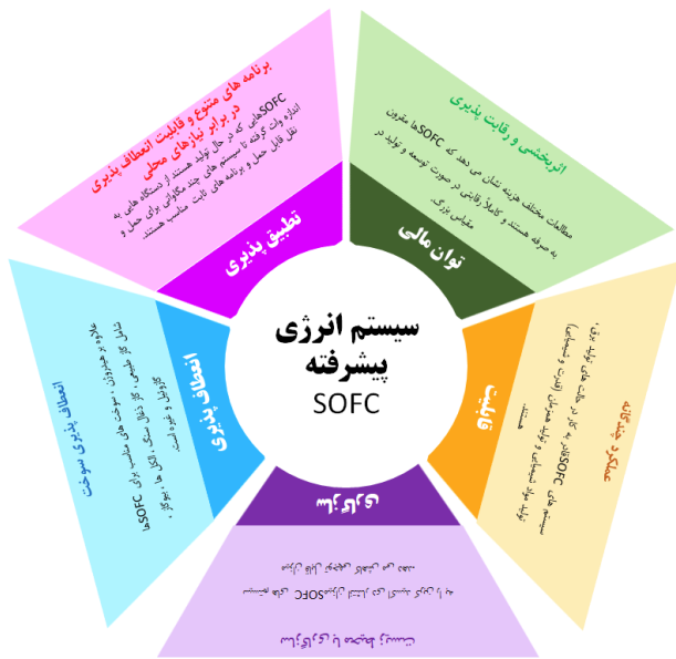
شکل ۱- مفهومی از سیستم سلول سوختی اکسید جامد به عنوان انرژی پاک و پایدار

سلول‌های سوختی اکسید جامد (SOFC) معمولاً برای دماهای بالا (حدوداً ۸۰۰ تا ۱۰۰۰ درجه سانتی‌گراد) برای کاربردهای ثابت در صنعت و ابزار استفاده می‌شوند. در حال حاضر، این نوع سلول‌ها اغلب از زیرکونیای تثبیت شده با ایتریا یا اکسید سریم گادولینیوم به عنوان الکترولیت استفاده می‌کنند [۷]. دمای خروجی این نوع سلول سوختی در حدود ۵۰۰ درجه سانتی‌گراد تا ۸۵۰ درجه سانتی‌گراد است که می‌تواند کاربرد بیشتری برای تولید همزمان یا برای سایر چرخه‌های تبدیل انرژی حرارتی باشد. سوخت در الکتروود آند یا الکتروود سوخت و هوا در الکتروود کاتد یا الکتروود جامد تشکیل می‌شوند و با مونوکسید کربن و هیدروژن موجود در سوخت واکنش می‌دهند و با حرکت الکترون الکتروسیسته تولید می‌کنند [۳-۱].