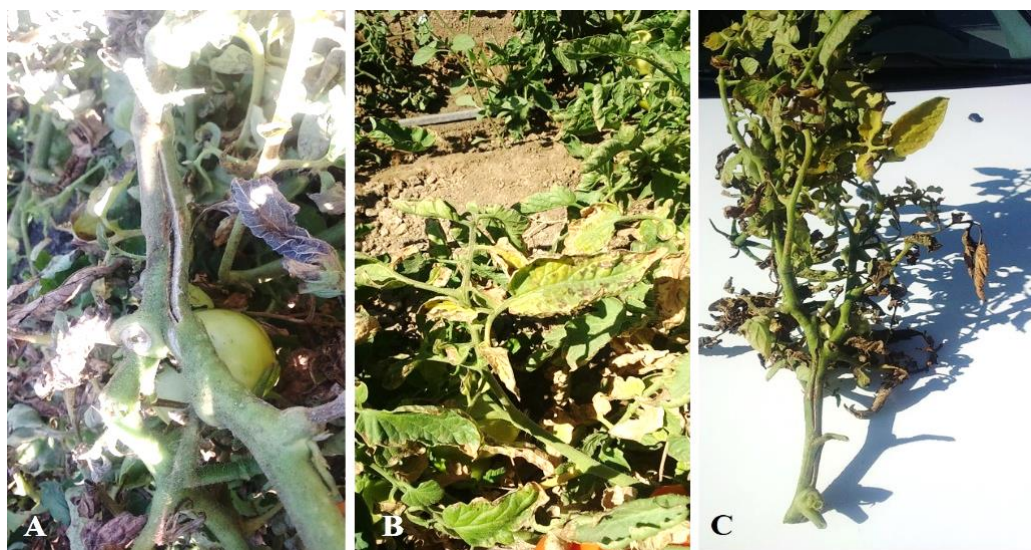
شکل ۱. نشانه بیماری شانکر باکتریایی گوجه‌فرنگی: A. شانکر روی ساقه، B. لکه‌های نکروز روی برگ‌ها، C. بوته آلوده با نشانه شانکر ساقه و برگ‌های نکروزه شده (اصلی).

خصوصیات فنوتیپی و مولکولی جدایه‌های باکتری: تمامی سویه‌های باکتری گرم مثبت، هوازی اجباری، کاتالاز مثبت و اکسیداز منفی بودند. باکتری‌ها میله‌ای شکل و بدون تحرک بوده و روی محیط کشت