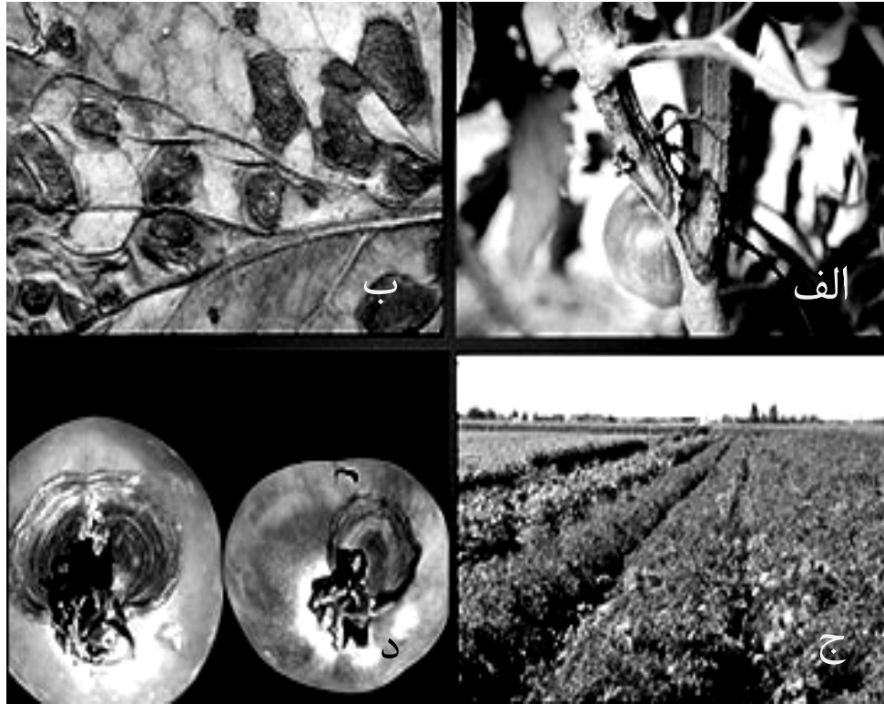
شکل ۲. نشانه‌های بیماری سوختگی زودهنگام گوجه‌فرنگی، الف. روی ساقه ، ب. روی برگ، ج. در مزرعه، د. روی میوه (انجمن بیماری‌شناسی گیاهی آمریکا www.apsnet.com ).

بوشهر و بندرعباس کشت می‌شوند، حدود ۶۰-۹۰ درصد برآورد شده است (صوفه‌جلیان، ۱۳۷۰). تعیین دقیق خسارت اقتصادی و محاسبه هزینه‌هایی که صرف مبارزه با این بیماری می‌شود، کار دشواری است و تنها هزینه سالانه‌ای که در جهان برای مبارزه شیمیایی با سوختگی زودهنگام گوجه‌فرنگی صرف می‌شود، ۳۳ میلیون دلار تخمین زده شده است (جونز و همکاران، ۱۹۹۱).