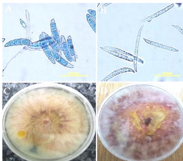
شکل ۲. خصوصیات مرفولوژیکی پرگنه و ماکروکنیدیوم‌های Fusarium culmorum (A, C) و F. pseudograminearum (B, D) روی محیط کشت PDA (اصلی).

منابع مختلفی از زادمایه اولیه برای گسترش پوسیدگی فوزاریومی طوقه و ریشه گندم شناخته شده‌اند. این منابع شامل بقایای محصولات مختلف از فصل گذشته نظیر گندم، ذرت، جو، سویا و برنج است. زمستان‌گذرانی گونه‌های Fusarium در خاک و بقایای گیاهی صورت می‌گیرد و می‌تواند برای چندین فصل به شکل گندرو در بافت‌های مرده میزبان به‌خصوص محصولات حساسی که در سال‌های متمادی کشت می‌شوند زنده بمانند. ساختار پایدار قارچ عامل بیماری پوسیدگی فوزاریومی طوقه و