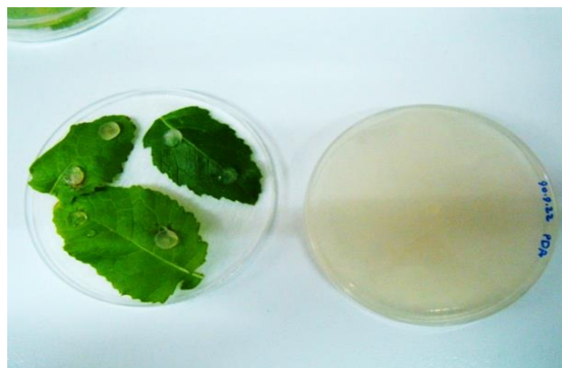
شکل ۱. حلقه میسلیومی Sclerotinia sclerotiorum روی برگ Brassica juncea var. Cutlass Figure 1. Sclerotinia sclerotiorum fungal mycelium plug on B. j var. Cutlass leaf