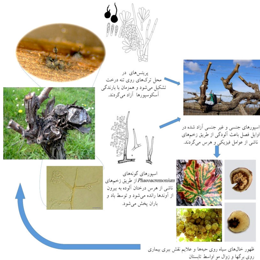
Figure 2- Grapevine Esca disease cycle