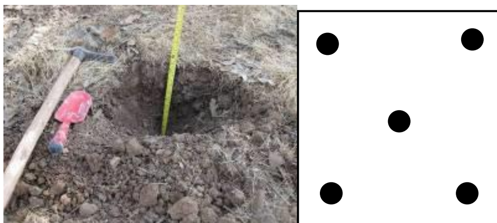
شکل ۱- محل‌های نمونه‌برداری خاک در قطعه نمونه (راست) و برداشت نمونه خاک از عمق ۰-۳۰ سانتی‌متری (چپ)

برای اندازه‌گیری کربن آلی خاک، در هر قطعه نمونه دائمی، پنج نمونه خاک در هر سال از عمق ۰-۳۰ سانتی‌متری برداشت شد (MacDicken, 1997) (شکل ۱). یکی از نمونه‌ها در مرکز پلات و سایر نمونه‌ها در چهار